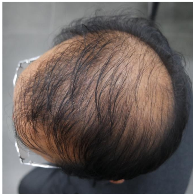
시술 58일 후 (04월 12일)