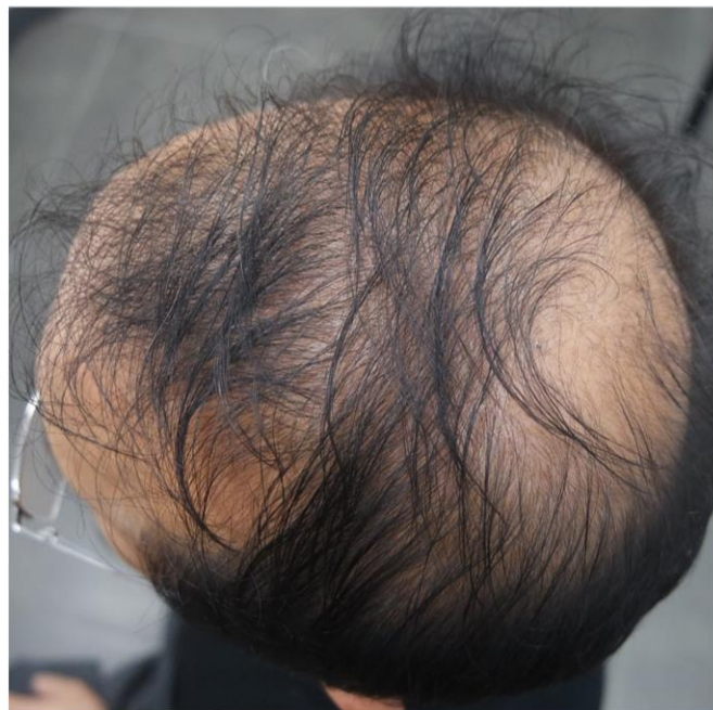
시술 전 (02월 14일)