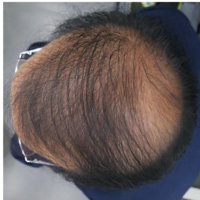
시술 80일 후 (05월 04일)